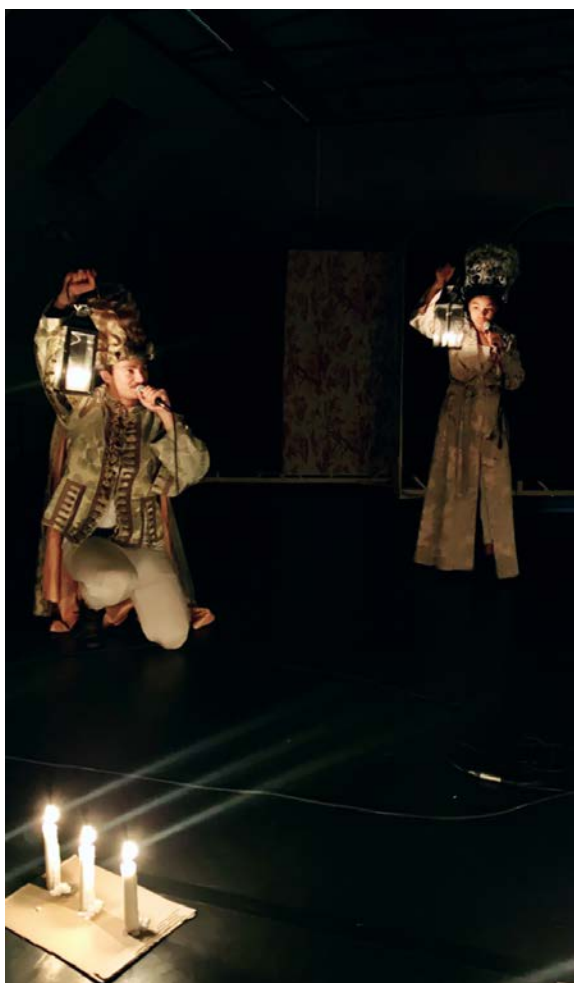
Photos de répétitions

Le projet « Par les villages » aura ainsi rempli sa mission : enrichir le regard du spectateur en lui offrant un accès plus complet et complice au spectacle vivant. La présence de la jeune troupe sur le territoire permet d'élargir les actions culturelles cette saison.