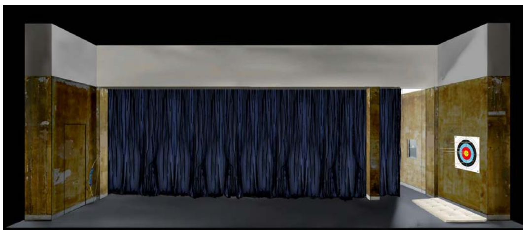
croquis de scénographie, par Nicolas Marie

Nous souhaitons que cet espace ne soit pas un espace de confort pour les personnages en attente du retour de Thésée, qui semblent camper dans le palais. Cette scénographie est pensée pour être en constante transformation grâce à son accessoirisation de départ. Ainsi nous assistons tout au long du spectacle à un espace qui se vide de ses attributs décoratifs et narratifs pour se dépouiller d'acte en acte et enfin arriver dans l'espace le plus minimal et aussi le plus classique et tragique, qui prend toute sa dimension dans une certaine abstraction, avec pour seule perspective les murs et la toile peinte figurant la mer. Une plongée accentuée par la fausse perspective de l'ensemble.