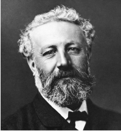
Jules Verne

Né en 1828 à Nantes, Jules Verne est le premier né d'une famille où l'on pratique la poésie de circonstance. L'écriture prend cependant toute la place dans la vie du jeune homme qui, monté à Paris pour ses études de droit, ne reprendra jamais la charge d'avoué de son père et se consacre tout d'abord au théâtre. Grâce à Alexandre Dumas, il fait jouer au Théâtre-Lyrique ses premières pièces. Quelques années plus tard, ses modestes succès deviennent des triomphes quand il adapte pour la scène, en collaboration avec D'Ennery, Le Tour du Monde en quatre-vingt jours , Michel Strogoff et Les Enfants du Capitaine Grant . C'est donc bien au théâtre, sa première vocation, autant qu'à ses romans, que Jules Verne doit gloire et fortune.