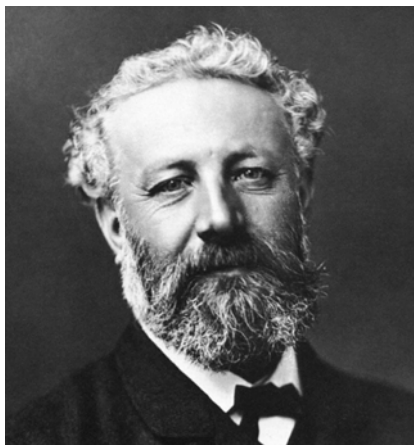
Jules Verne photographié par Félix Nadar

Né en 1828 à Nantes, Jules Verne est le premier né d'une famille où l'on pratique la poésie de circonstance. L'écriture prend cependant toute la place dans la vie du jeune homme qui, monté à Paris pour ses études de droit, ne reprendra jamais la charge d'avoué de son père et se consacre tout d'abord au théâtre. Grâce à Alexandre Dumas, il fait jouer au Théâtre-Lyrique ses premières pièces. Quelques années plus tard, ses modestes succès deviennent des triomphes quand il adapte pour la scène, en collaboration avec D'Ennery, Le Tour du Monde en quatre-vingt jours , Michel Strogoff et Les Enfants du Capitaine Grant . C'est donc bien au théâtre, sa première vocation, autant qu'à ses romans, que Jules Verne doit gloire et fortune.